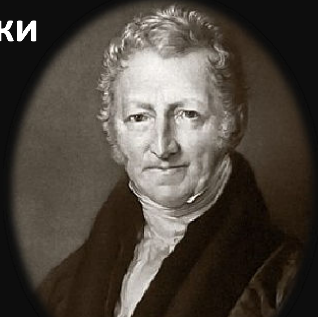
Томас Роберт Мальтус (1766—1834) — английский священник и учёный, демограф и экономист.

Мальтузианская ловушка: рост населения обгоняет рост производства, поэтому часть человечества обречена на безработицу, голод, нищету, пока не начнется искусственное регулирование рождаемости.