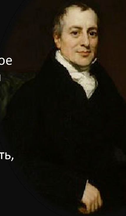
Давид Рикардо «Начала политической экономии и налогового обложения» (1817г.)